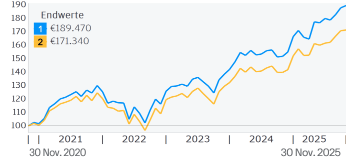
ZUWACHS VON 100.000 EUR Kalenderjahre