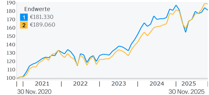
ZUWACHS VON 100.000 EUR Kalenderjahre